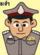
ข้าราชการ/พนักงาน รัฐวิสาหกิจ