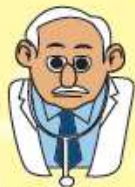
แพทย์, วิศวกร ฯลฯ