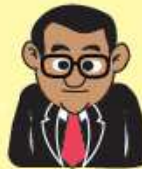
ผู้บังคับบัญชา