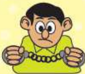
ผู้ต้องหา/จำเลย