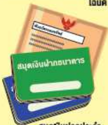
สมุดเงินฝากประจำ